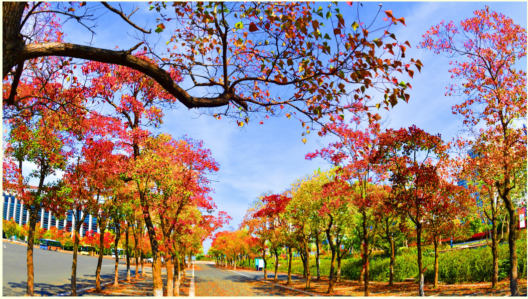
10月18日，宿迁市湖滨新区网红打卡点——骆马湖度假区游客服务中心停车场。秋季的宿迁充满诗情画意，五彩缤纷的宿迁处处是惊喜