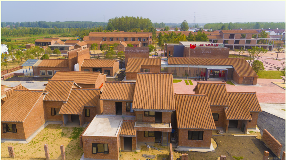
10月20日，在宿迁市洋河新区三葛酒村特色新居建设现场，工人正在有序施工。该项目坚持“最苏北、最乡村、最生态、最质朴”的开发理念，巧妙利用现有房屋结构，有机结合村落的现有院落内外树木景观环境，选取绿色建筑材料——木、土、石、竹，打造一种回归田园、天人合一的生态休闲旅居空间，致力打造宿迁最美红砖村